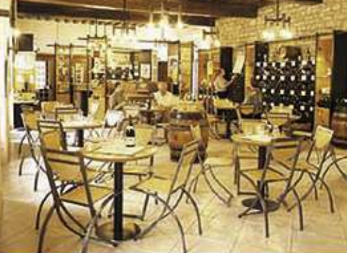
L'espace de dégustation The atmospheric wine tasting area Weinprobierraum und -Boutique