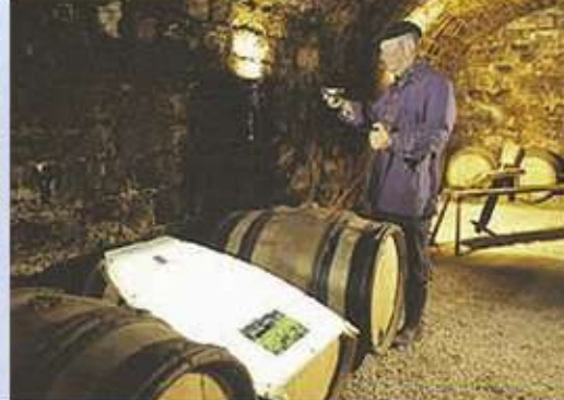
L'ancienne cave «Napoléon» The historic "Napoleon" cellar Der traditionsreiche «Napoleon»-Keller