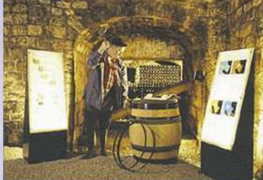
Le caveau «Bacchus» et son musée The "Bacchus" cellar and museum Der «Bacchus» Keller mit Museum